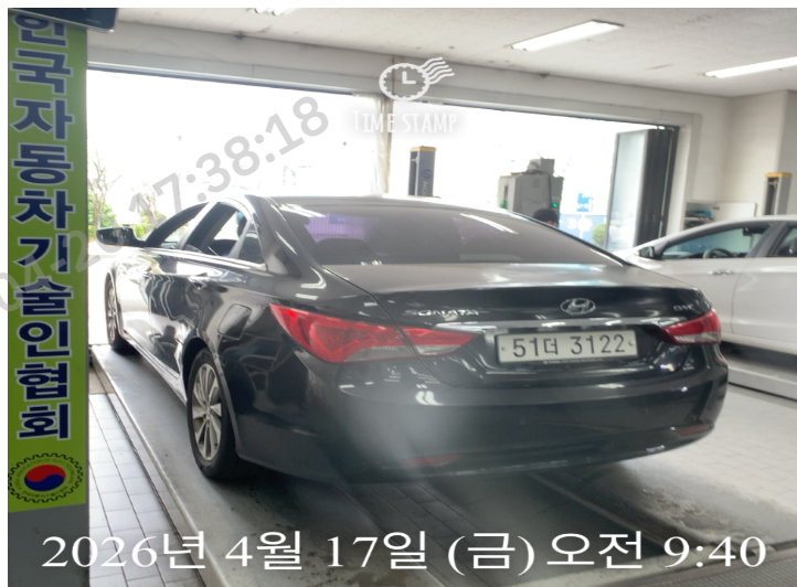
2026년 4월 17일 (금) 오전 9:40